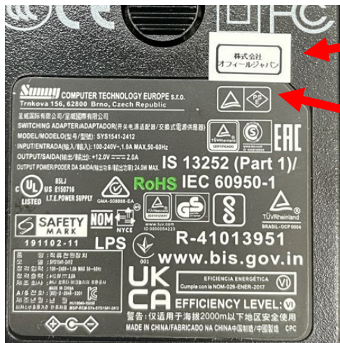
例 2 非対応品