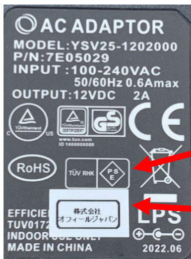
例 3 非対応品 別モデル